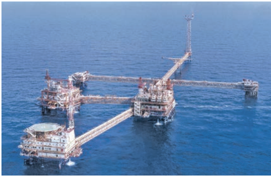
Auch für Offshore-Plattformen gilt: Die Qualität der Oberflächentechnik ist mitverantwortlich für Sicherheit und Langlebigkeit