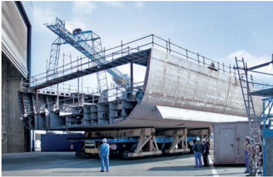
Fregatten, Yachten oder Kreuzfahrtschiffe: Mit modernstem Equipment und höchsten Qualitätsansprüchen sorgen wir für die souveräne Umsetzung von Lösungen für den Schiffsbau