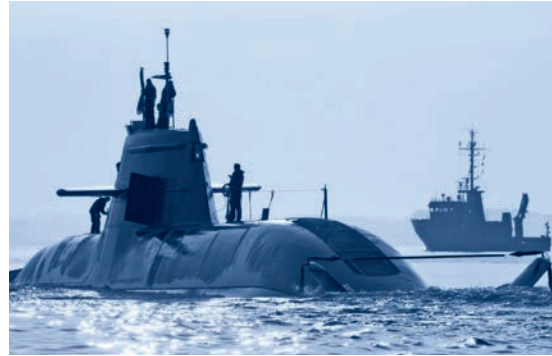
Der Korrosionsschutz von U-Booten erfordert besonders anspruchsvolle Beschichtungen. Unser speziell geschultes Personal verfügt auch auf diesem Spezialgebiet über spezifische Projekterfahrungen