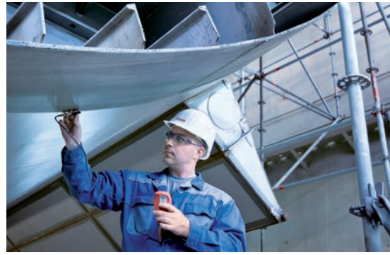
Schichtdickenmessungen und das Erstellen von Prüfprotokollen für den TÜV sind feste Bestandteile unserer umfangreichen Qualitätssicherungsmaßnahmen